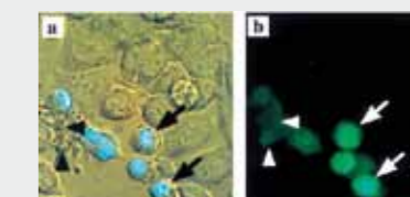
DÉTECTION D'UNE SURPRODUCTION DE H_2O_2 PAR FLUORESCENCE DANS DES CELLULES STRESSÉES. H_2O_2 OVERPRODUCTION DETECTION IN CELLS UNDERGOING OXIDATIVE STRESS VIA FLUORESCENCE.

Afin de caractériser les EAO et la capacité des cellules à les éliminer, de nombreux tests ont été mis au point au Laboratoire de Génétique et Biologie Cellulaire (LGBC) à Versailles. Ces tests sont réalisés sur des cultures de cellules humaines ou sur des extraits de tissus et reposent pour la plupart sur des mesures d'absorption (colorimétrie) ou d'émission de lumière (bioluminescence, fluorescence). Ces techniques permettent de mesurer les différentes EAO en présence, leurs quantités respectives, ainsi que les activités enzymatiques susceptibles de les éliminer. Les méthodes colorimétriques sont principalement utilisées pour mesurer l'activité des enzymes importantes pour la détoxification des EAO (SOD, CAT, GPX). Elles sont particulièrement intéressantes pour étudier l'effet de molécules antioxydantes qui agissent en stimulant les défenses