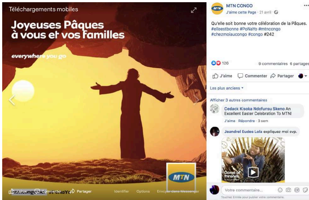
Image 7. Copie d'écran des pages Facebook de l'opérateur MTN