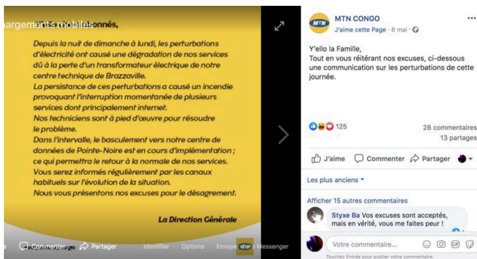
Image 1. Copie d'écran des pages Facebook de MTN

l'agencement de l'information construit par Facebook, il est identifié comme un premier commentaire avec comme particularité que ce premier commentaire est produit par le fournisseur de l'image de gauche, ce qui ne correspond pas aux pratiques habituelles sur Facebook et peut être analysé comme une manipulation des « abonnés » à cette liste MTN, même si MTN s'en protège en évoquant un processus de réitération des excuses intégrées dans l'image de gauche. MTN « aime cette page », c'est-à-dire sa propre page au risque d'y voir un excès d'investissement narcissique.