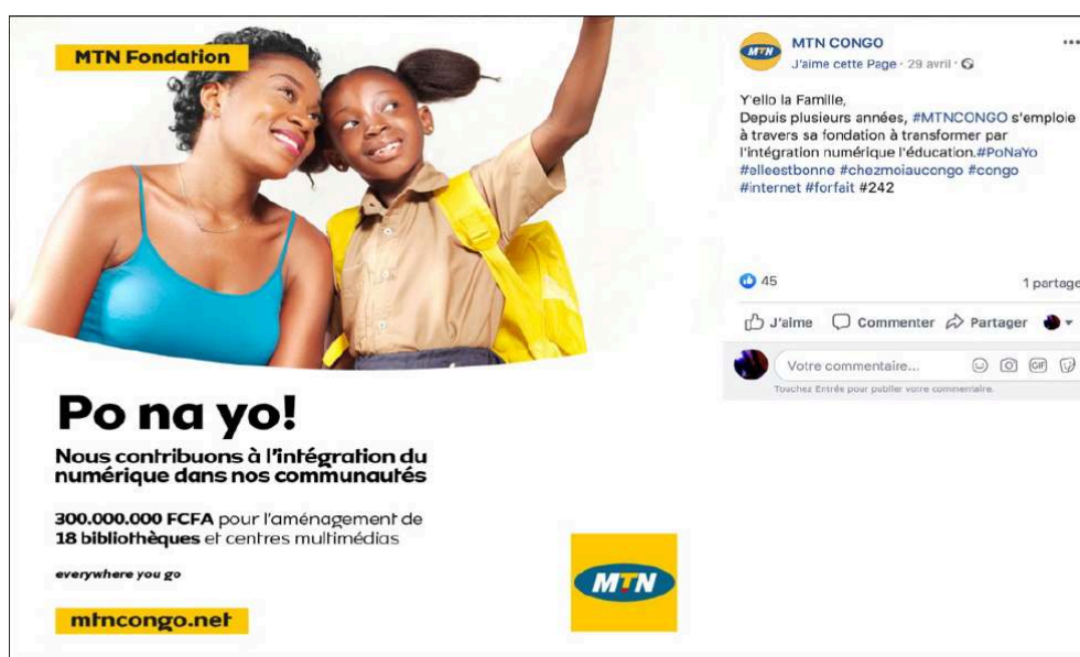
Image 4. Copie d'écran des pages Facebook de MTN