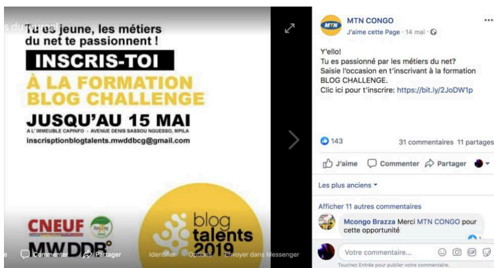
Image 3. Copie d'écran des pages Facebook de MTN