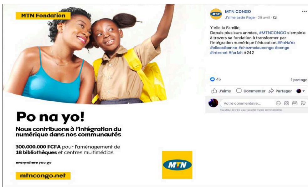
Image 4. Copie d'écran des pages Facebook de MTN